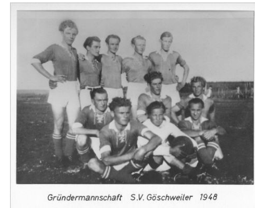
Gründermannschaft S.V. Göschweiler 1948